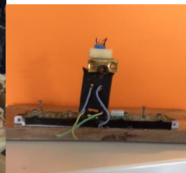
Mannetje op bank

Oude apparaten uit elkaar halen en er weer een nieuwe bestemming aangeven in het kader van techniek.