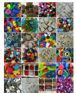
Using loose parts for play

Voor een nieuwe, nog te maken hoek, zijn wij op zoek naar o.a. knopen, steentjes, doppen en vul maar in. Mocht u iets over hebben, graag inleveren bij de juffen van de groepen 1-2. Ook zoeken wij eierdozen.